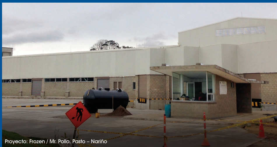
Proyecto: Frozen / Mr. Pollo, Pasto – Nariño